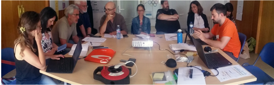
Unha das primeiras reunións

Moitas foron as ideas e reflexións sobre o barrio e por momentos parecía que nunca íamos ser quen de concretar; queríamos pasar a acción, executar unha actividade, pero ao mesmo tempo non queríamos renunciar a outras. Foi así como xurdiu a idea dun arquivo, unha proposta ambiciosa para o tempo que tiñamos e da que non sabiamos moito como facer. Porén, decidimos seguir adiante con ela e preparar un Plan Director, documento que nos fixo de guieiro para saber se realmente era un arquivo o que queríamos facer e no caso de que si, como é que se fai iso.