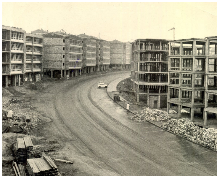
Barrio de Vite en construción. Anos 70.

O barrio de Vite atópase na periferia da cidade de Santiago de Compostela (A Coruña) no que, como sucede noutros tantos barrios, se produciron moitos cambios ao longo do século XX. A súa historia recente é un exemplo moi interesante de como os espazos e, polo tanto, as prácticas sociais rurais e urbanas foron cambiando no tempo deixando a súa pegada na paisaxe, entendida tanto como o propio espazo físico xunto coas prácticas sociais que nel se desenvolven. Un proceso de construción de barrio que combina a vellos e novos residentes, de grupos heteroxéneos, que foron tecendo redes de conexión para a resolución de conflitos que xurdiron a partir da súa adaptación a un novo espazo en construción. Esta creación de comunidade, que vai aparecendo a raíz de conectar pasado e futuro , é parte imprescindible para entender e traballar entorno ao patrimonio inmaterial que queremos recuperar, investigar e mostrar.