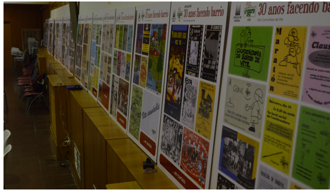
Exposición do 30º aniversario do Plan Sociocomunitario