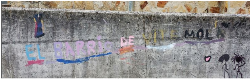
Pintada feita polas crianzas do barrio

O material verquido polas catro actividades relatadas anteriormente é agora o coñecemento que está a nutrir o proceso de traballo e recollido no documento que nesta altura estamos a elaborar; o Plan de Activación do Arquivo da Memoria de Vite . Un documento que será a folla de ruta a seguir a curto medio prazo.