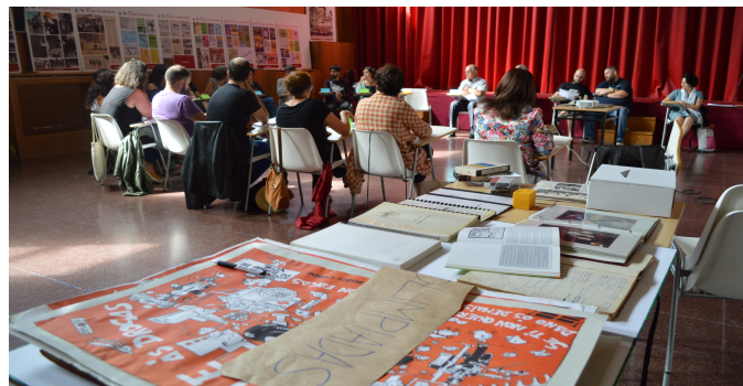
Encontro "Como facer xuntas un Arquivo para Vite?"