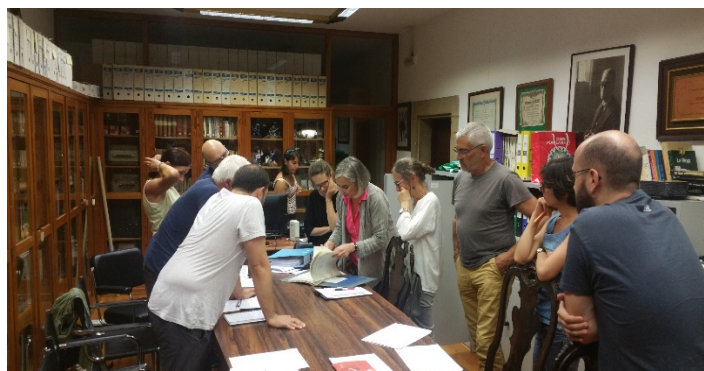
Visita ao APOI no Museo do Pobo Galego

Comezábamos de cero, desde a ignorancia máis absoluta de non saber como son as entrañas dun arquivo. Foi por este motivo e para gañar experiencia e saber facer, polo que decidimos, de acordo co Plan Director xa deseñado, realizar catro actividades diferentes.